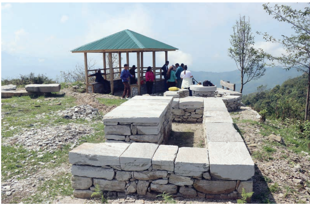
संखुवासभाको चिचिला गाउँपालिका- ४ कुवापानीदेखि बलुथाम जाने लालीगुराँस पदमार्गमा निर्माण गरिएको ढुंगाको चौतारा। रिव्स सरकारको पदमार्गमा आधारित पर्यटन विकास परियोजना (टिटिडिपी) कार्यक्रमअन्तर्गत लालीगुराँस पदमार्ग निर्माणको काम भइरहेको छ। रिव्स सरकार, संघ, प्रदेश र चिचिला गाउँपालिकाको साभेदारीमा पदमार्ग निर्माणको काम भइरहेको हो। पदमार्ग निर्माणपछि आन्तरिक तथा बाह्य पर्यटकहरूको आवागमन बढ्न थालेको छ।