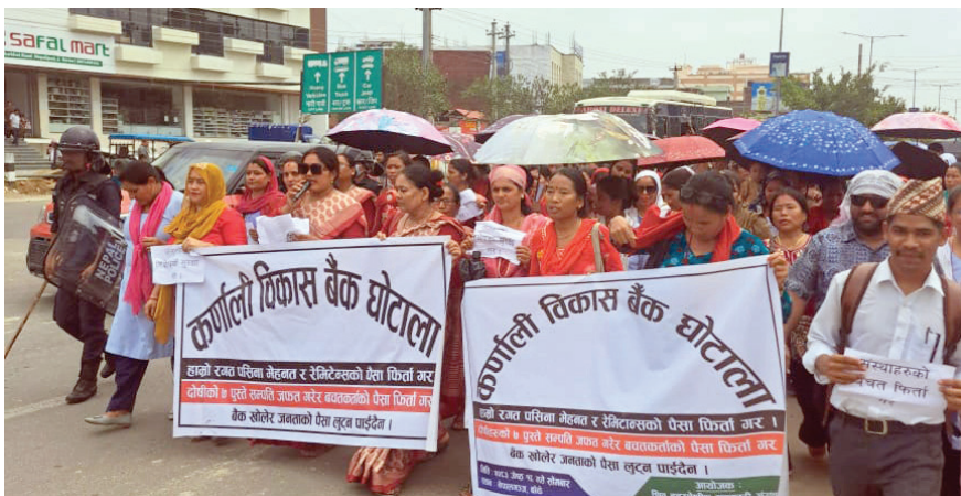
डेढ वर्षदेखि आफ्नो बचत रकम फिर्ता नपाएको भन्दै कर्णाली विकास बैंकका बचतकर्ताले नेपालगन्जमा आन्दोलन गरेका छन् । नेपाल राष्ट्र बैंकले समस्यारूपत घोषणा गरेको बैंकमा निक्षेपकर्ताको करिब चार अर्ब ३० करोड निक्षेप रहेको राष्ट्र बैंकले जनाएको छ ।