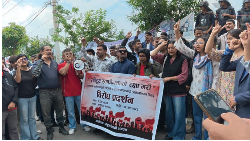
प्रधानमन्त्रीको अभिव्यक्तिको विरोधमा संयुक्त विद्यार्थी संगठनले सोमबार माइतीघरमा गरेको प्रदर्शन।