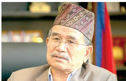
चिरिबाबु महर्जन, मेयर, ललितपुर महानगर