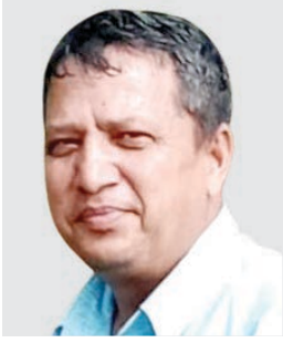
● उद्व अधिकाारी अग्रलेख

चालू आवभन्दा भन्डै ११ अर्बले घटेको कृषि बजेटले सरकार स्वयंको कृषि क्षेत्रको पुनरुत्थान गर्ने शीर्ष प्राथमिकतालाई न्याय गर्न सक्दैन